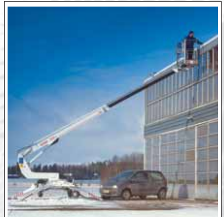
Med den stadiga men lätta konstruktionen uppnås en räckvidd på 8,3 m.

Rätten till tekniska ändringar förbehålles.