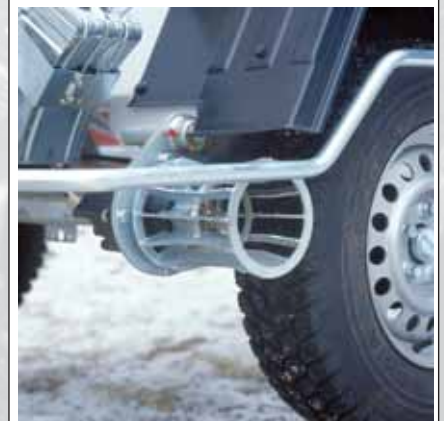
Drivsystemet (standard) gör det lätt att förflytta DINO I25T.