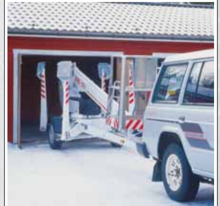
Den smala transportbredden möjliggör tillträde till trånga platser.