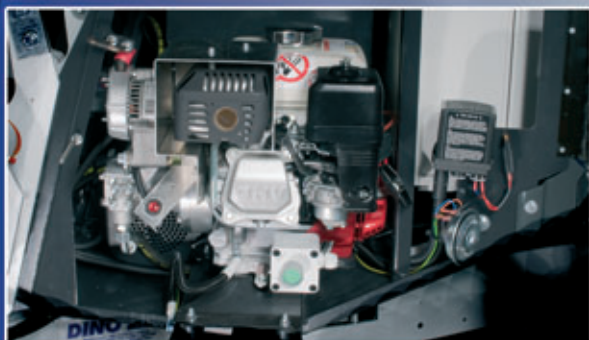
Bensinaggregat som standardutstyr - liften kan brukes uten tilgang på nettstrøm.