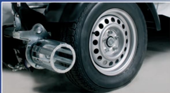
Brukervennlig hjelpedrift - enkel og uanstrengt flytting for en person.