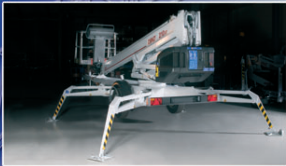
Unike hydrauliske støtteben - høy bakkeklaring på liten flate.